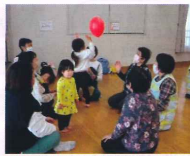
パパ・ママ・じーじ・ばーば いつでも参加OKです。