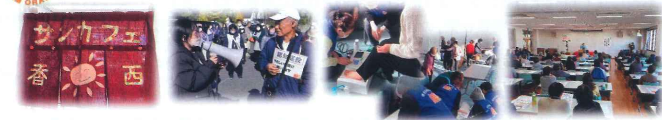
サンカフェ香西 (月4回毎木曜日13:00～15:30) お気軽にお立ち寄りください

(*) チームオレンジとは、厚労省の事業のひとつで地域住民の認知症サポーターの方々などがチームを組み、同じ地域で暮らす認知症の方とその家族の見守りや支援を行うことを目的とした活動