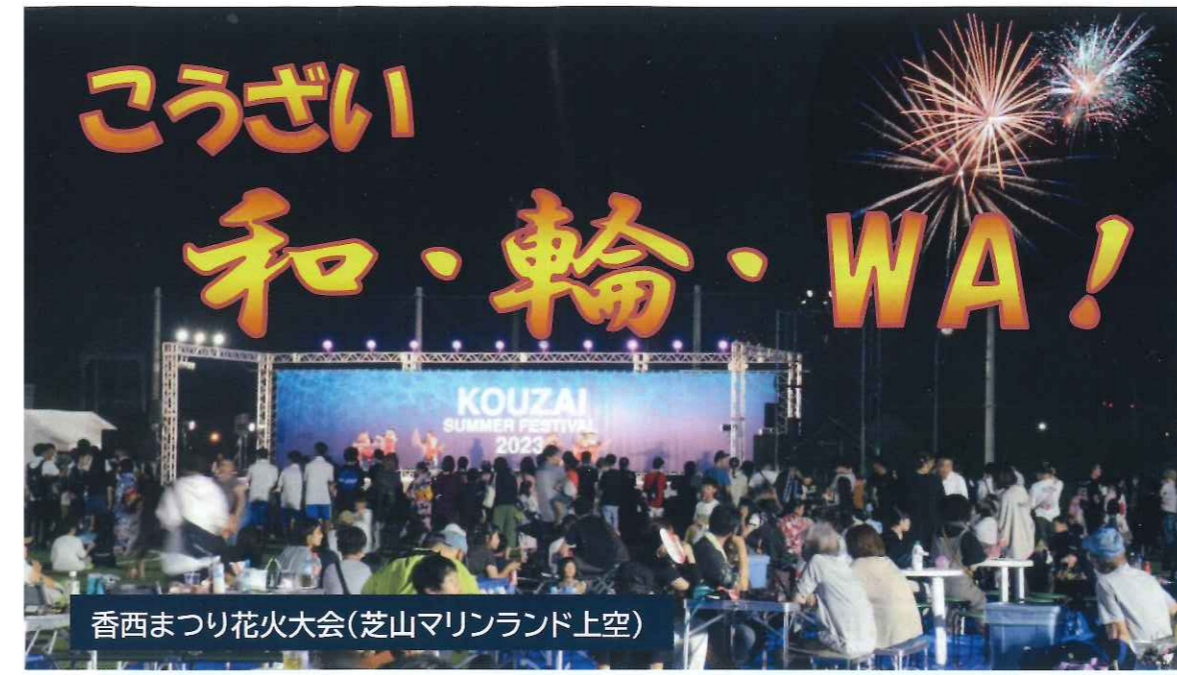
香西まつり花火大会(芝山マリンドーム上空)