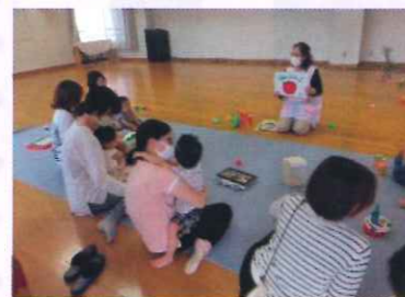
＜香西保育所＞の先生と遊ぼう

おじいちゃん おばあちゃん お父さん お母さん、子どもたち みんなで遊ぼう!! 世代間交流がありました。